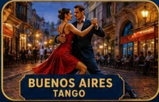
BUENOS AIRES TANGO